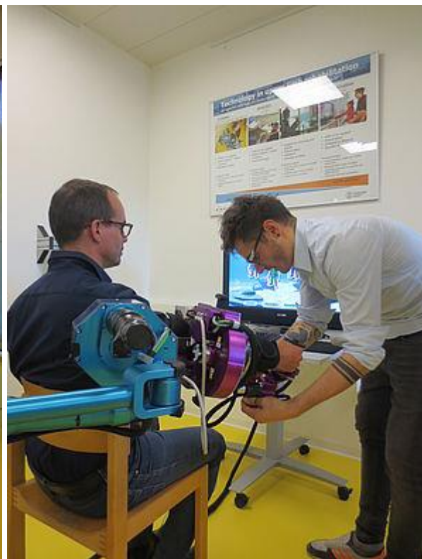
Eindrücke aus den Workshops des lokalen Gastgebers